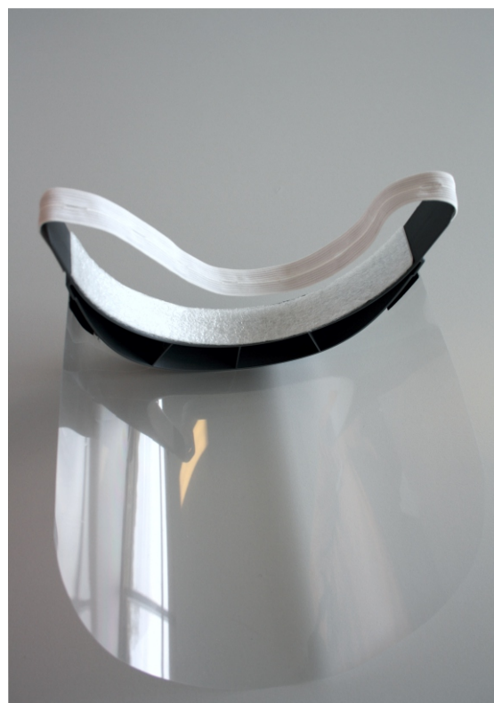
Visiret er polstret innvendig med mykt 3mm skum med lukkede celler.

Smittevernvisir i glassklar kvalitet montert på «avstandsholder» i en myk plastkvalitet som former seg etter pannen, polstret innvendig med mykt 3mm skum med lukkede celler. Regulérbar elastikk rundt hodet. Visiret er robust og tåler tøff behandling.