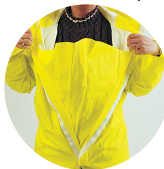
Åpning i front med innvendig "vifte" med borrelåslukking. Gir god beskyttelse mot sprut.