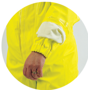
Armmansjetter med strikk

Hel drakt uten støvler, produsert i fluoriserende farge som gjør brukeren lett synlig. Drakten er kjemikalie / flammehemmende antistatisk. Fastmontert hette. leveres i 5 størrelser, fra small til xxlarge