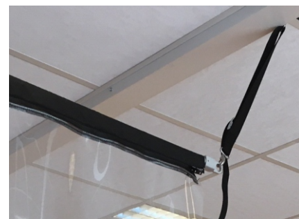
Enkelt å feste i tak med justerbar reim og krok i hver ende.