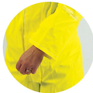
Ekstra utvendig mansjett for beskyttelse av hanske