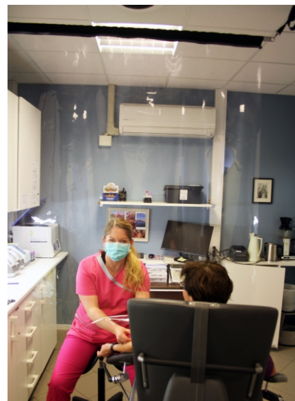
På laboratorie ved prøvetaking